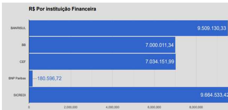
GRÁFICO 1 - Fonte: RELATÓRIO REFERÊNCIA